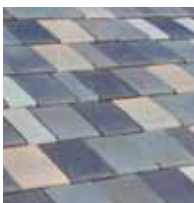
ルドスレートプレミアム

ルドスレートは、斧で割った石板のような質感と様々な厚さを持った当社独自のインターロッキング型瓦です。瓦同士をずらしながら配置することで、素朴感を強めることが出来ます。