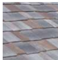
ルドシェイクプレミアム

「ルドシェイク」と「ルドシェイクプレミアム」は斧で割った木片のような質感と様々な厚さを持った当社独自のインターロッキング型瓦です。